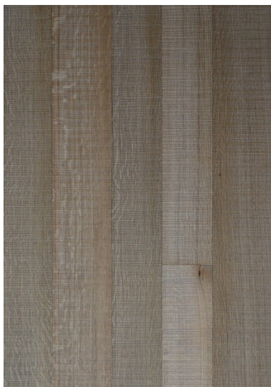
PURISTIC massiv Draufsicht : Fläche